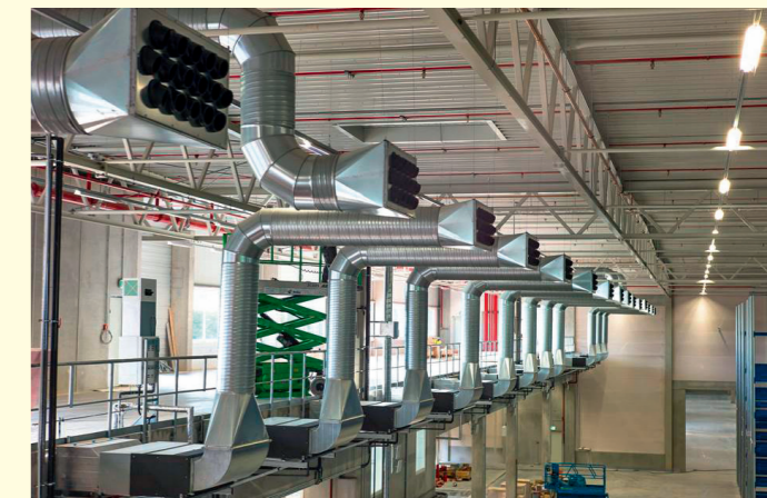
4 – VRV-Innengeräte mit angeschlossener Luftverteilung

mit 3,75 beziffert werden müsste. In Verbindung mit dem wesentlich günstigeren Energiepreis schneidet sie im Verhältnis zur elektrischen Wärmepumpe also deutlich besser ab (Bild 1). Hinzu kommt, dass bei elektrisch betriebenen Wärmepumpen zusätzlich Kosten durch die Bereitstellung elektrischer Leistung anfallen können, z. B. durch größere Trafo-Stationen, Zuleitung usw. Außerdem vermeidet die Gasmotorwärmepumpe elektrische Lastspitzen im Firmennetz.