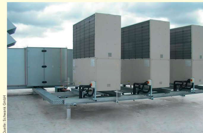
3 – Dachmontage von drei Gasmotorwärmepumpen

bereitgestellt. Das spiegelt der Strompreis im Verhältnis zu Gas wider (ca. 1:3). Die Effizienz einer Wärmepumpe wird durch die Jahresarbeitszahl (JAZ) abgebildet. Sie gibt das Verhältnis der über das Jahr abgegebenen Wärme zur aufgenommenen Energie an. Pauschal sagt man: Je höher die JAZ, desto besser die Effizienz. Systemübergreifend gilt diese Aussage aber nicht. Die JAZ einer Elektrowärmepumpe liegt mit etwa 3,5 zwar höher als die JAZ einer Gasmotorwärmepumpe (ca. 1,5), berücksichtigt man jedoch den Kraftwerkswirkungsgrad, erkennt man, dass die JAZ der Gasmotorwärmepumpe eigentlich